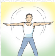
नियमित जीवन और स्वास्थ्य जांच