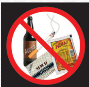
शराब, तम्बाकू से मुक्त जीवन